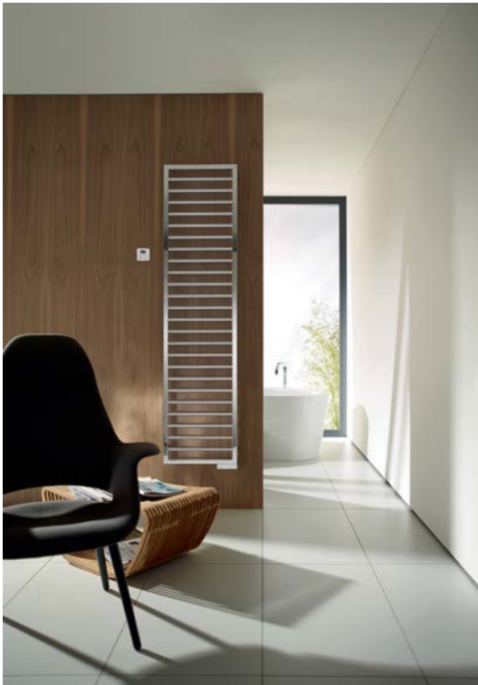
Ausführung Elektrobetrieb inklusive Steuergerät.