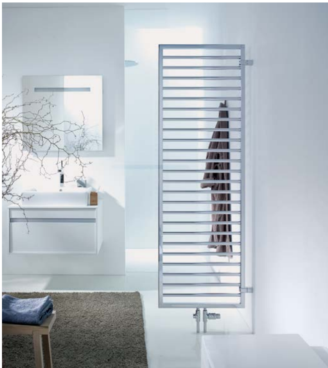
Ausführung mit optionalem Raumteiler-Montageset.