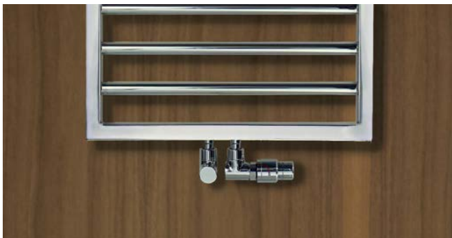
Ausführung Warmwasserbetrieb mit Zehnder Thermostat und Zehnder Komfort-Armatur in Chrom.

V20190922, RAD_DAS, DE_de, Änderungen vorbehalten